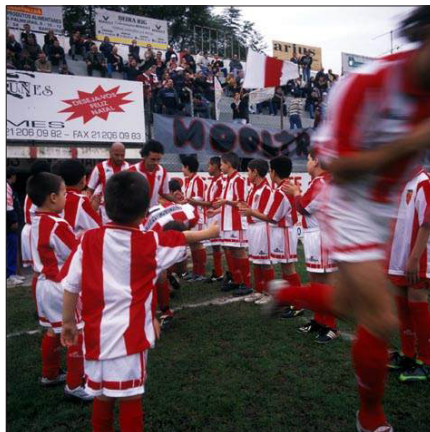
Pedro Letria Estádio Manuel de Mello. Barreirense vs Pinhal Novo, II Divisão, Zona Sul, 2003. PT/AMLSB/LET/000013

É com esta exposição que fechamos o ciclo de apresentações sobre a fotografia a cores analógica, a partir de textos e conjuntos de imagens que representam o acervo da Instituição, com o objetivo de introduzir uma reflexão sobre a produção da imagem colorida em Portugal.