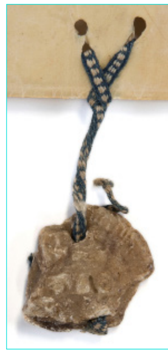
Figura 18 Selo de D. Afonso V (1454). AML, Chancelaria Régia, Livro 2º de D. Duarte e D. Afonso V, doc. 37.