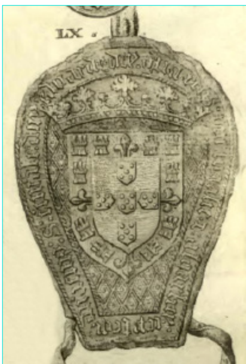
Figura 15 Selo de D. Duarte (SOUSA, António Caetano de – História genealógica... , nº LX).