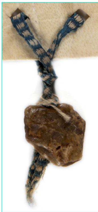
Figura 8 Selo de D. João I (1410). AML, Chancelaria Régia, Livro 2º de D. João I, doc. 21.