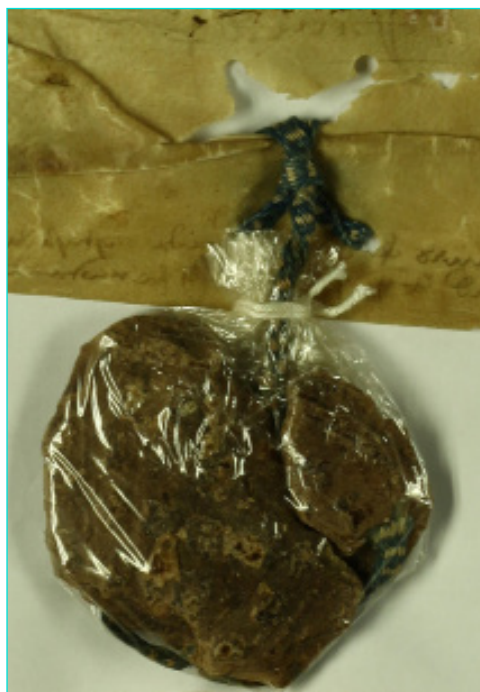
Figura 16 Selo de D. Afonso V (1445). AML, Chancelaria Régia, Livro 2º de D. Duarte e D. Afonso V, doc. 28.

O rei com maior número de selos ou de vestígios de selos no Arquivo Municipal de Lisboa é D. Afonso V. São quatro selos pendentes, todos reduzidos a fragmentos praticamente delidos e com restos de legenda ilegíveis 65 , um selo de chapa que subsiste 66 , embora em mau estado, e seis outros, de chapa também, de que resta somente a marca 67 .