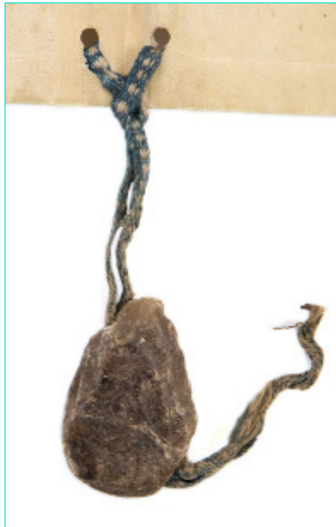
Figura 19 Selo de D. Afonso V (1461). AML, Chancelaria Régia, Livro 2º de D. Duarte e D. Afonso V, doc. 44.