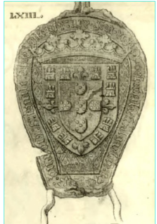
Figura 20 Selo de D. Afonso V (SOUSA, António Caetano de – História genealógica... , t. 4, nº LXIII).

Os selos pendentes, de cera, parecem ser impressões da matriz de formato oblongo usualmente utilizada por este rei (figs. 16 a 19), e de que a gravura de Caetano de Sousa nos dá, de novo, a melhor imagem (fig. 20) 68 . Segue de perto o selo do mesmo tipo de D. Duarte, mantendo todas as inovações que este introduzira, incluindo a designação de selo curial e a legenda a começar do lado esquerdo do selo: S(igillvm) curiale d(om)ny Alfonsy Dey gratia regis Portugalie et Algarbiy Cepte[que domini] 69 .