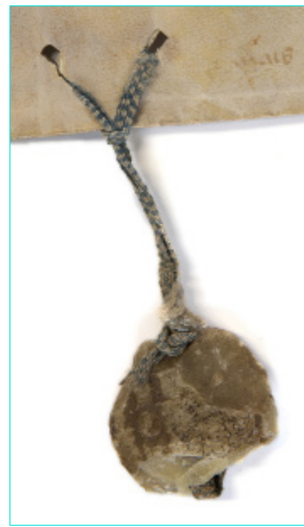
Figura 14 Selo de D. Duarte (1437). AML, Chancelaria Régia, Livro 2º de D. Duarte e D. Afonso V, doc. 13.