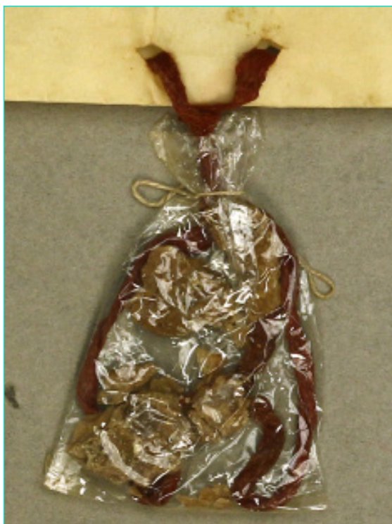
Figura 5 Selo de D. Fernando (1376). AML, Chancelaria Régia, Livro 2º de D. Fernando, doc. 12.