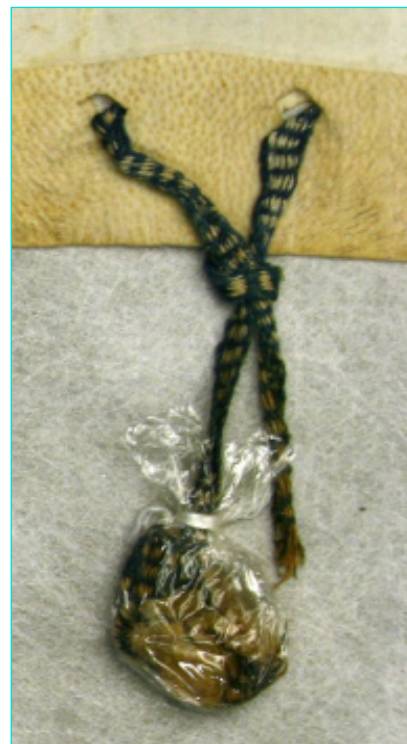
Figura 9 Selo de D. João I (1414). AML, Chancelaria Régia, Livro 2º de D. João I, doc. 31.