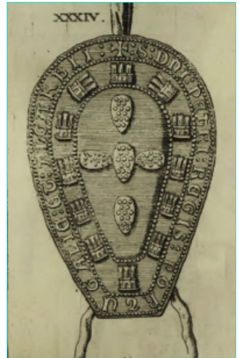
Figura 4 Selo de D. Pedro I (SOUSA, António Caetano de - História genealógica..., t. 4, nº XXXIV).

dada em Sintra 34 (fig. 3). Trata-se da parte superior do selo, muito delida e fragmentada em três pedaços que alguém procurou consolidar sem grande sucesso. Num dos lados, o rebordo contém restos ilegíveis da legenda, e vêem-se, mal, três escudetes, o superior e os laterais, sendo a parte mais nítida o filete pontilhado que separa as quinas dos castelos; na outra face, estes vêem-se um pouco melhor, e ainda se conseguem decifrar algumas letras da parte superior da legenda: a cruz inicial, o S de S(igillvm) e o D e I de D(om)ni , assim como o P do nome do rei.