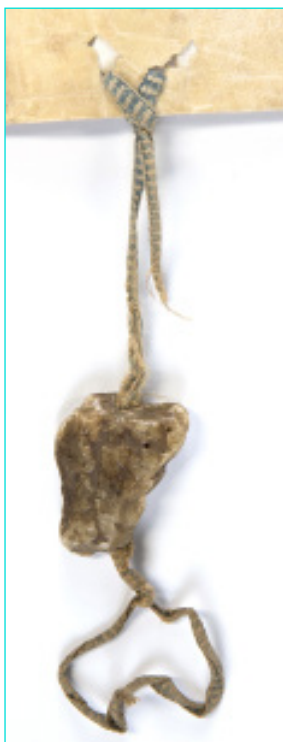
Figura 12 Selo de D. Duarte (1434). AML, Chancelaria Régia, Livro 2º de D. Duarte e D. Afonso V, doc. 4.