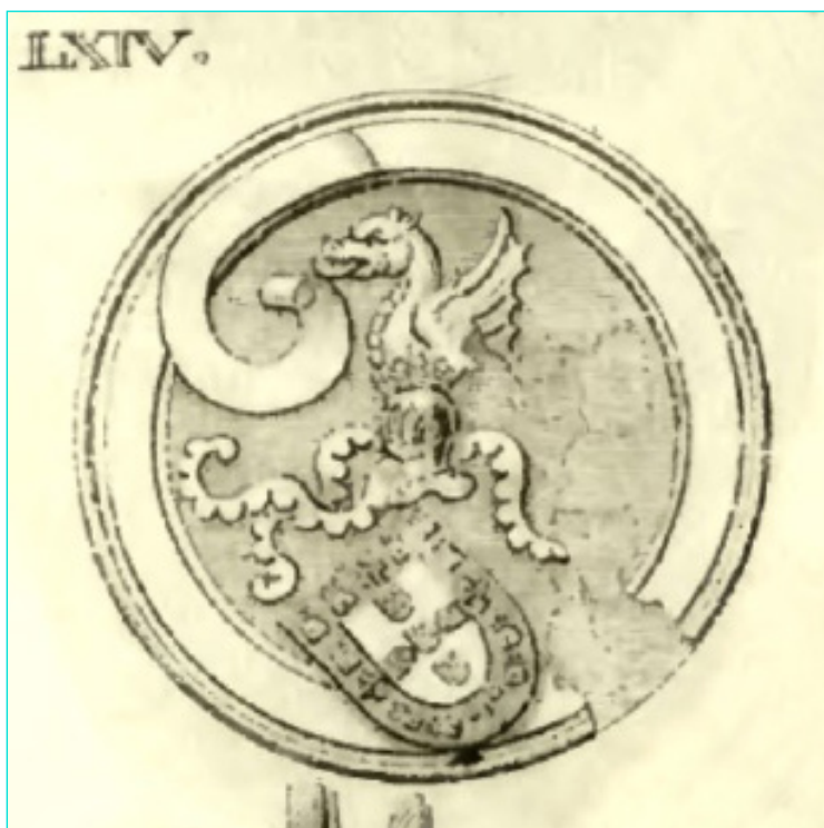
Figura 22 Selo de chapa de D. Afonso V (SOUSA, António Caetano de – História genealógica... , t. 4, nº LXIV).

Este é um selo com uma exuberância heráldica típica do derradeiro século medieval, apresentando o escudo real au ballon (ou seja, inclinado para a esquerda), com o elmo coroadado e uma serpe alada por timbre. A serpe surgira na heráldica dos reis de Portugal provavelmente ainda no reinado de D. Fernando, mas foi com a Dinastia de Avis que passou a ser representada com regularidade, em especial na escultura 71 . Este é o primeiro selo de que temos notícia em que tal elemento externo surge. Curiosamente, a legenda em letra gótica minúscula inicia-se como uma filacteria saindo da boca da serpe, desenrolando-se depois em torno da orla sigilar. Não se consegue, porém, ler com o mínimo de certezas que permita propor uma transcrição.