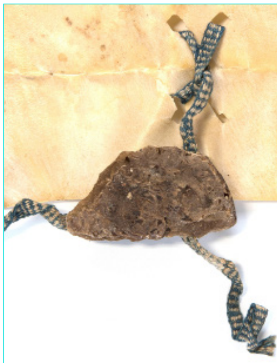
Figura 13 Selo de D. Duarte (1437). AML, Chancelaria Régia, Livro 2º de D. Duarte e D. Afonso V, doc. 11.