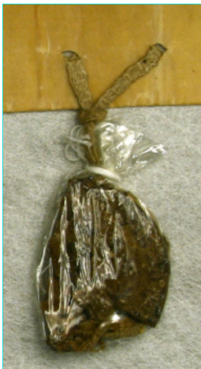
Figura 7 Selo de D. João I (1409). AML, Chancelaria Régia, Livro 2º de D. João I, doc. 20.

Dos reis seguintes conservam-se mais espécimes sigilares no Arquivo Municipal de Lisboa, nenhum, porém, infelizmente, em bom estado. São três de D. João I, outros tantos de D. Duarte, e cinco de D. Afonso V, aos quais se podem acrescentar os vestígios de alguns selos de chapa. Os quatro selos que restam de D. João I datam dos anos de 1409, 1410, 1414 e 1416 45 (figs. 7 a 10). Os três mais recentes encontram-se reduzidos a fragmentos com dimensões não superiores a 30 mm; o mais antigo é um pouco maior (40x55 mm), mas corresponde a menos de um quarto do selo total. Nenhum deles permite qualquer leitura, mas é possível perceber que todos foram impressos pela mesma matriz, de formato oblongo, que conhecemos graças a outros exemplares e, em especial, à gravura de Caetano de Sousa (fig. 11) 46 , e que é a única usada em selos de cera que se conhece deste rei, embora seja provável que tenha tido outras durante o seu longo reinado 47 .