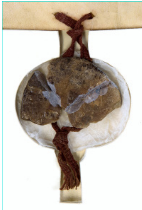
Figura 3 Selo de D. Pedro I (1362). AML, Chancelaria Régia, Livro 2º de D. Dinis, D. Afonso IV e D. Pedro, doc. 32.