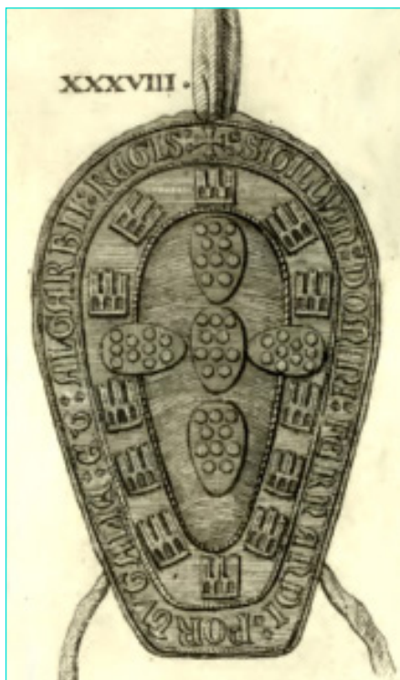
Figura 6 Selo de D. Fernando (SOUSA, António Caetano de – História genealógica... , t. 4, nº XXXVIII).

Também de D. Fernando resta neste Arquivo um só selo, reduzido a pequeníssimos fragmentos de cera castanha delidos, colados à fita tecida vermelha suspensa de um ato escrito do rei dado em Leiria, a 24 de novembro de 1376 39 (fig. 5). Tratando-se de um documento que regulamenta o ofício de tabelião, não é provável que fosse o selo redondo que D. Fernando usou em diplomas de impacto internacional, como tratados, e que era equestre no anverso e heráldico no reverso, como os de seu avô e outros antecessores, já referidos 40 . Deveria ser o selo de cera usual, de que conhecemos apenas alguns exemplares em mau estado, a maioria dos quais reduzidos a fragmentos de menor ou maior dimensão 41 . É forçoso recorrermos, de novo, a Caetano de Sousa para encontrarmos um desenho que mostre um selo intacto (fig. 6) 42 .