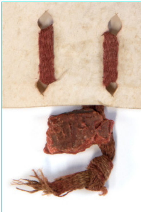
Figura 1 Fragmento de selo de D. Afonso IV (1350). Arquivo Municipal de Lisboa (AML), Chancelaria Régia, Livro 2º de D. Dinis, D. Afonso IV e D. Pedro, doc. 29.