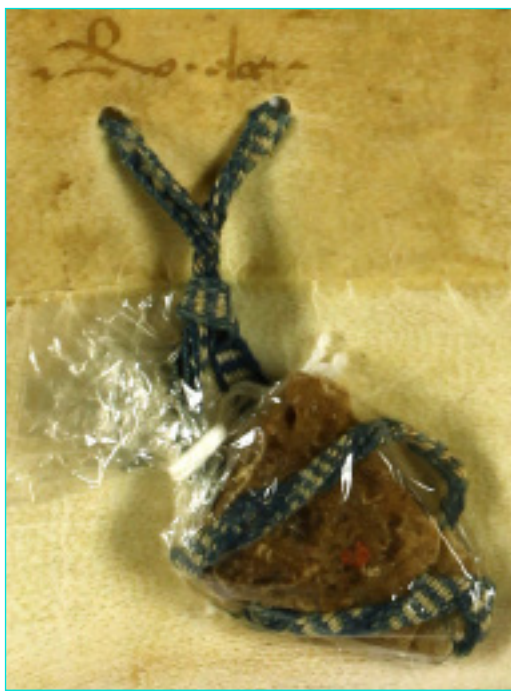
Figura 17 Selo de D. Afonso V (1450). AML, Chancelaria Régia, Livro 2º de D. Duarte e D. Afonso V, doc. 30.