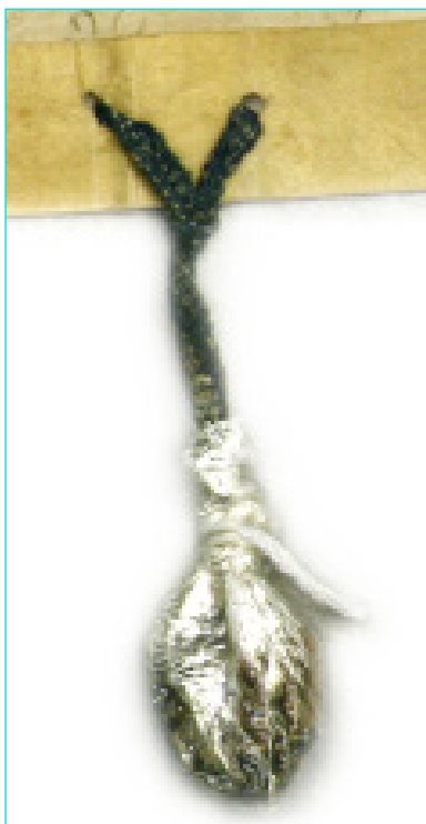
Figura 10 Selo de D. João I (1416).