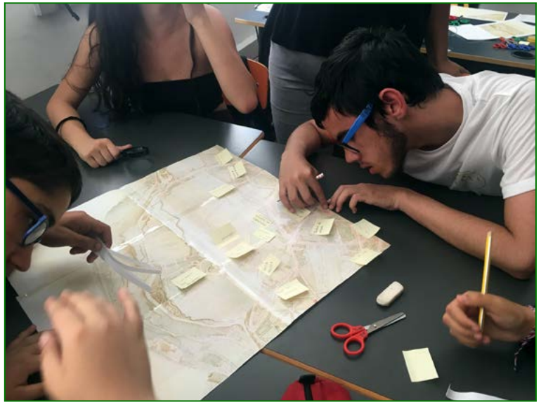
Figura 3 Atividade Passo a passo pelo bairro da minha escola: transformações e permanências.

A cada ano letivo novos desafios se configuram, não só aos professores como a todos os agentes educativos, no desenvolvimento de competências dos alunos do século XXI.