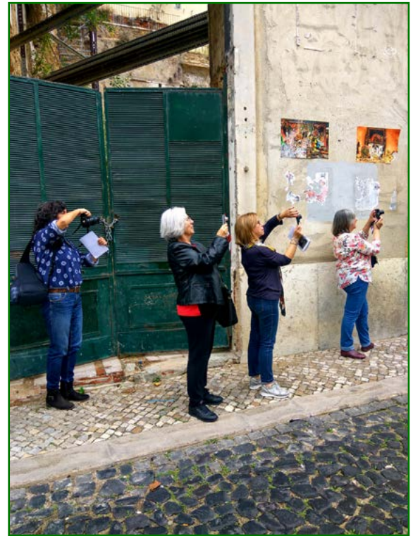
Figura 6 Oficina Fotografar Lisboa, inserida na exposição Lisboa uma grande surpresa . Equipa do Serviço Educativo do Arquivo Municipal de Lisboa, 2016. AML.

vida e sustentabilidade da cidade; construir uma noção de cidade em transformação ou reinvenção, concluindo, por fim, que a transformação é uma constante.