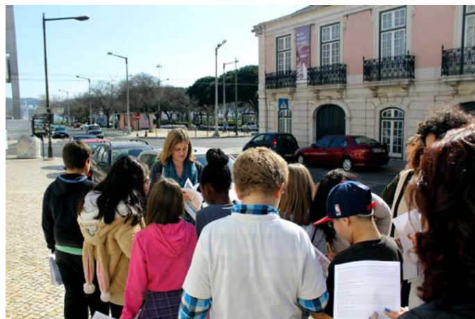
Figura 2 Percurso de Explorar a Cidade em Belém com alunos do CED Nuno Álvares Pereira.

estreita relação com as escolas ao longo de todo o ano letivo, trabalhando as competências dos alunos com uma ampla oferta de atividades educativas.