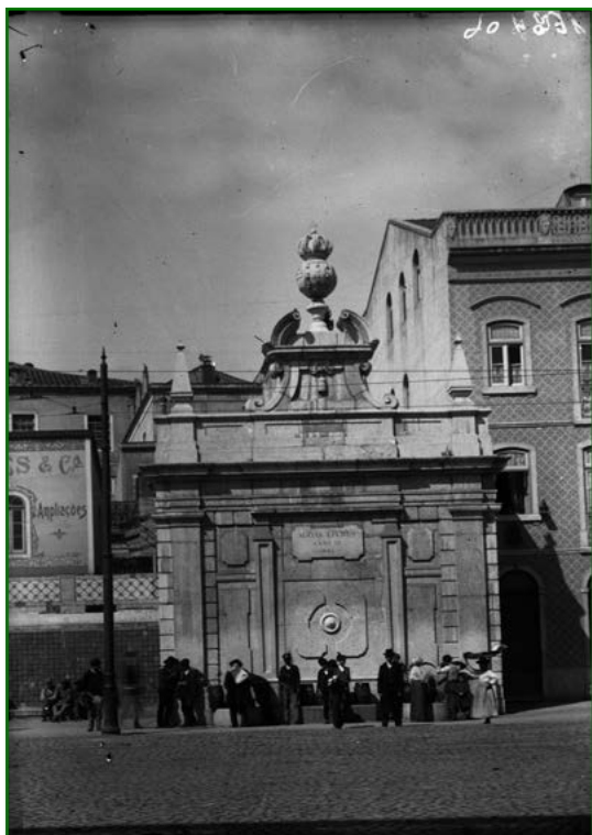
Figura 4 Chafariz do Intendente [entre 1898 e 1908]