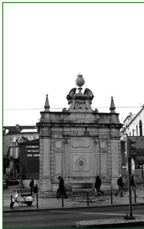
Figura 5 Chafariz do Intendente [21 novembro 2016]

Desde 2007, o Explorar a cidade foi realizado em 22 bairros diferentes, geograficamente opostos. Dos Olivais a Belém, os alunos são motivados a explorar as características próprias e únicas de cada um deles, promovendo o seu sentido de pertença. Neste último ano letivo de 2018/2019, foram realizadas 27 atividades que contaram com a participação de 737 alunos do 3º ano do Ensino Básico.