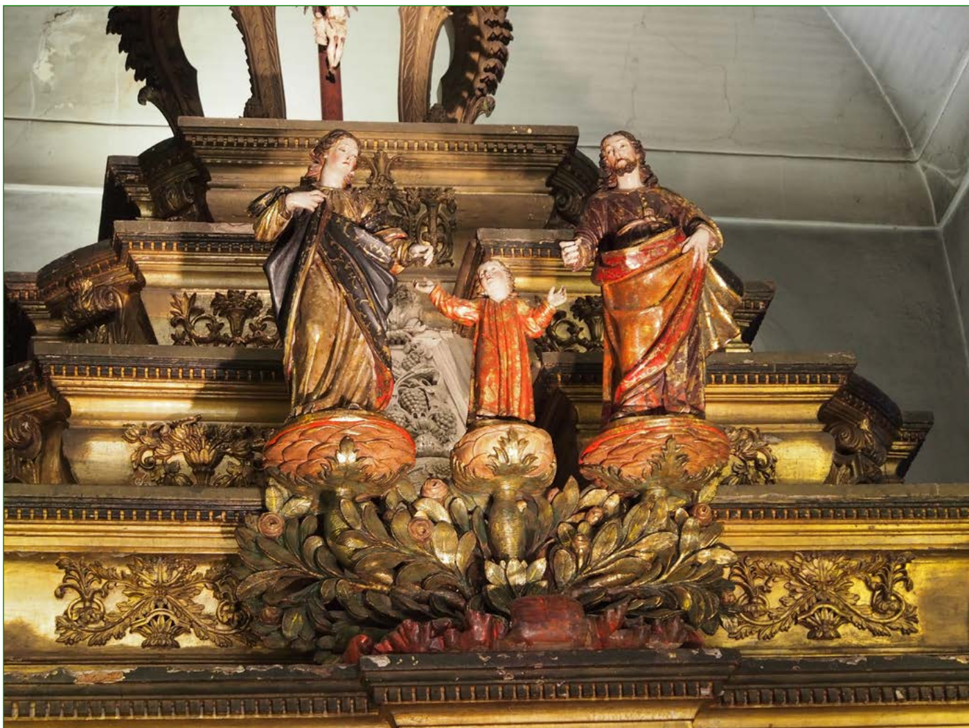
Figura 1 Sagrada Família, Altar-mor da Igreja de São José dos Carpinteiros.

Se 15 de maio de 1545, momento de apropriação do chão onde seria edificada a ermida dedicada a São José, constituiu o momento simbólico da fundação física do bairro, 20 de novembro de 1567 constituiu o seu momento fundacional de um ponto de vista ideológico. A ermida, de carácter privado, transformava-se em sede paroquial de uma nova freguesia, um novo ponto difusor ao serviço da propaganda contrarreformista 16 . A escolha de São José como patrono da nova freguesia não se tratou, portanto, de uma coincidência, já que as designações atribuídas a lugares são muito raramente aleatórias 17 .