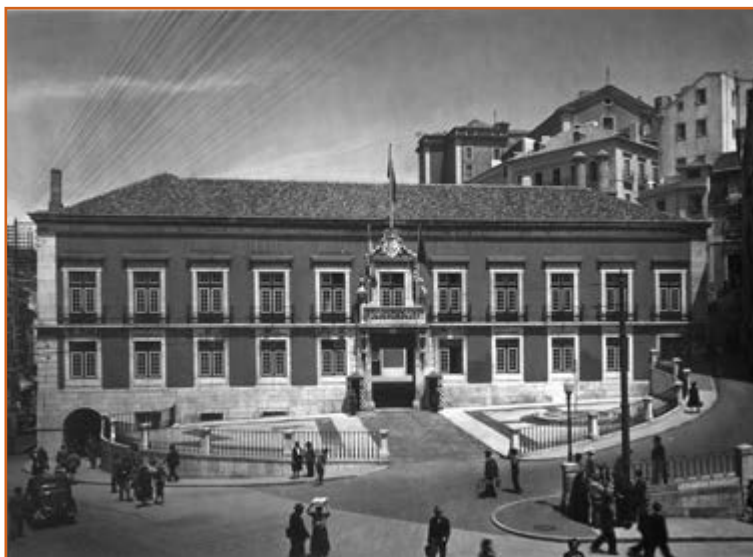
Figura 1 Palácio dos condes de Almada Arquivo Municipal de Lisboa, Armando Seródio, Palácio Almada – fachada principal , 1960, PT/AMLSB/FDM/001881.

no Palácio dos Almadás. O decreto régio, datado de 5 de maio desse ano, descreve a situação precária em que a Casa da Suplicação se encontrava: não era possível “congregar todos os Ministros (...) para o despacho della no lugar onde presentemente se tem as suas sessões” 2 . A dificuldade em reunir a totalidade dos desembargadores causava demoras que prejudicavam as partes.