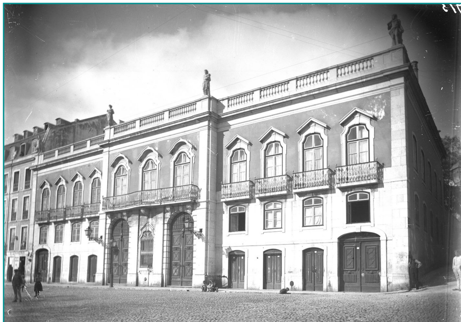
Figura 3 Palácio Sinel de Cordes (entre 1898 e 1908).