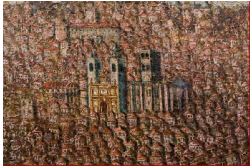
Figura 5 Representação do Arco dos Italianos na Sé de Lisboa. Pormenor da Vista de Lisboa, do Castelo de Weilburg. 28 .