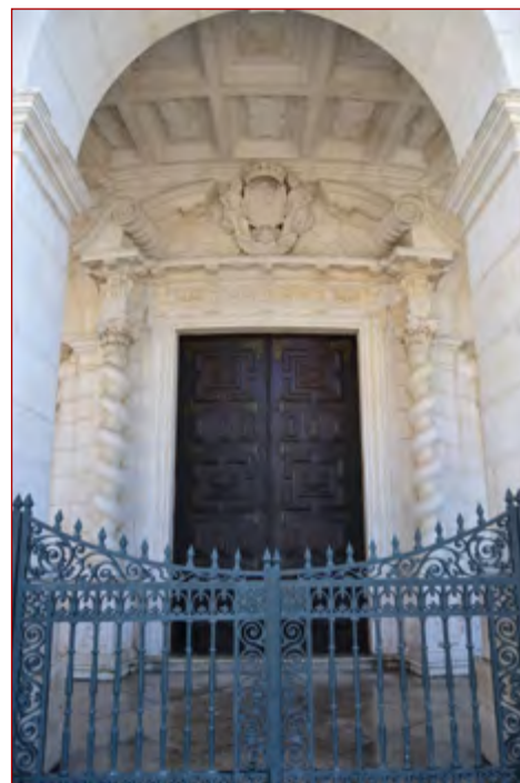
Figura 11 Portal da igreja de Santa Engrácia (Lisboa).

O casamento de D. João V com D. Mariana de Áustria (1683-1754), em 1708, também foi profícuo no que à construção de arcos diz respeito. Através de várias fontes 46 e estudos 47 , sabe-se hoje da proliferação destes espécimes pelas várias artérias da capital, sendo particularmente curioso aquele erguido junto do Pelourinho, pelos pormenores que o contrato para a sua feitura nos dá 48 . Esse arco, com acabamento pictórico encomendado a 19 de outubro de 1708 aos pintores Manuel Miranda e Pedro Baptista, apresentava “(...) o enuazamento e