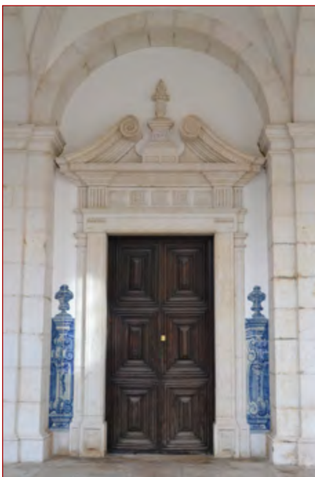
Figura 9 Portal de um dos claustros do mosteiro de S. Vicente de Fora (Lisboa).