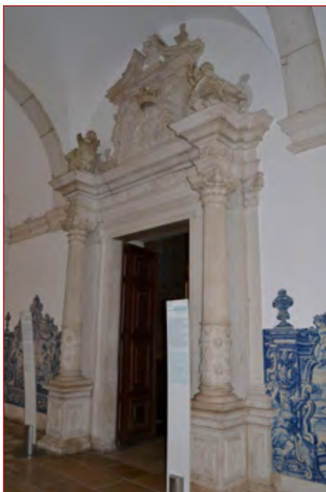
Figura 8 Portal da sacristia do mosteiro de S. Vicente de Fora (Lisboa).