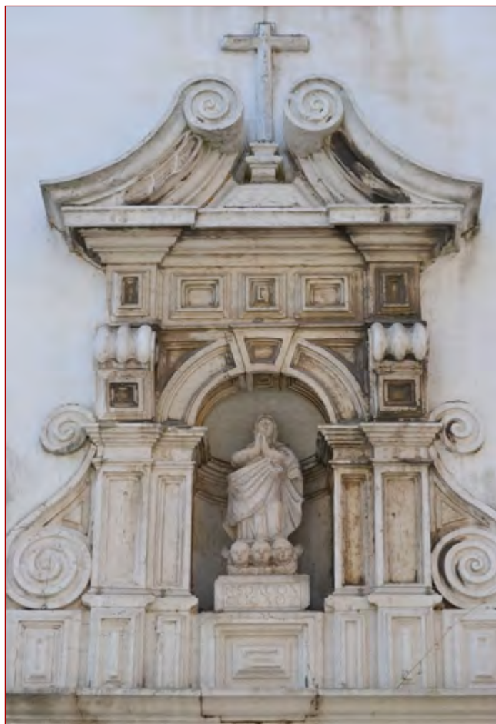
Figura 7 Pormenor do portal da igreja do convento de Nossa Senhora dos Cardais (Lisboa).

albergavam imagens, neste caso as alegorias às minas de ouro e prata das conquistas portuguesas, com clara analogia a modelos replicados no contexto religioso, com imagens devocionais. O modelo preconiza mesmo o que, como voltaremos a referir mais adiante é o esquema compositivo utilizado no portal da igreja do convento dos Cardais de Lisboa (QUADRO I).