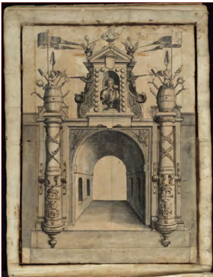
Figura 1 Desenho de porta não identificada, dimensões: 36 x 48 cm, [Lisboa, c. 1661]. Biblioteca Nacional de Portugal (BNP), Secção de Reservados, LANGRES, Nicolau de – Desenhos e plantas de todas as praças do Reyno de Portugal... Cód. 7445.