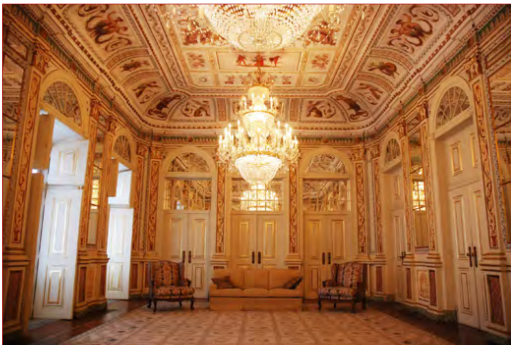
Figura 11 Visualização geral da Sala de Baile do Palácio Porto Covo [Em linha]. [Consultado 20.10.2016]. Disponível na internet: http://www.casaruibarbosa.gov.br/acasasenhorial/ .

doiradas: o tecto é ovado, e d'elle pendem dois lustres de dez luzes cada um, e do mesmo artifício, e riqueza que os outros 65 (ver Figura 11).