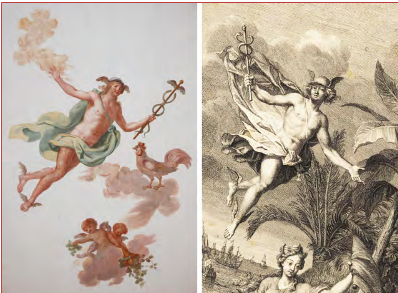
Figuras 6 e 7 Deus Mercúrio na pintura de teto da Sala de Recepção do palácio Porto Covo, realizada a partir de gravura de Bernard Picart. In / ’Asie & ses parfums, les trésors de l’Afrique, et de l’une & autre Amerique , 1719.

A escolha iconográfica aponta para ligações com a academia francesa de Roma, muito provavelmente desde os seus tempos de permanência nesta cidade. Esta academia teve um papel decisivo e influente na vida artística em Roma aquando da sua fundação em 1666, promovendo obras que divulgavam o lastro deixado pela cultura greco-romana. A admiração pelos artistas relacionados com a Academia de França em Roma é percecionada através do seu Tratado de Simetria : “Poussin, Le Brun, Le Seur, Mignarde, foram mestres que transferirão à França o gosto da Itália e dos antigos” 54 .