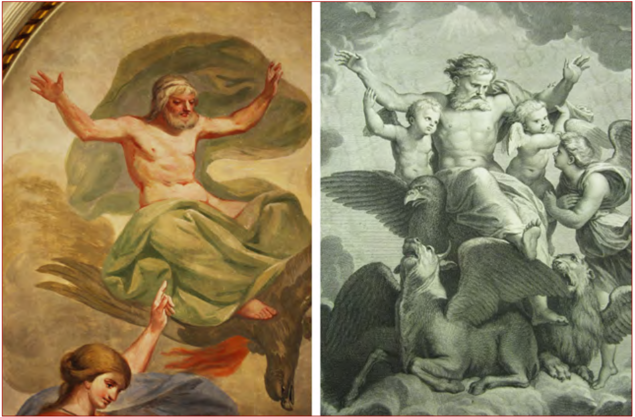
Figuras 9 e 10 Pormenor do deus Júpiter no teto da Sala de Visitas do palácio Porto Covo, de Cyrillo Volkmar Machado, realizado a partir de gravura de Nicolas Larmessin, da pintura de Rafael Sanzio A visão de Ezequiel . In BASAN, François – Recueil d'estampes d'après les plus beaux tableaux et d'après les plus beaux desseins qui sont en France . Paris: Chez Basan, 1763. tome premier.

Isócrates, até à época de Cícero, Horácio, Diodoro da Sicília (...). A reputação de Parrásio acompanhou a cultura antiga desde sempre. E o que é mais importante é que não só as suas obras são descritas, mas a sua arte e técnica são igualmente caracterizadas, assim como em períodos posteriores os seus desenhos foram utilizados como modelos para os artistas 57 .