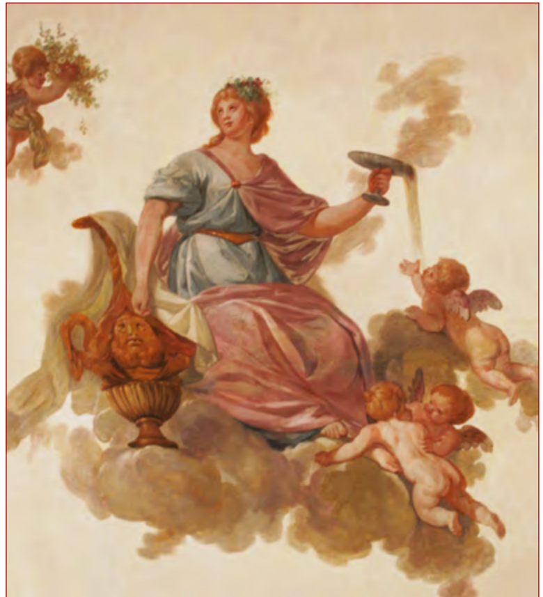
Figura 14 Pormenor da deusa Hebe de Cyrillo Volkmar Machado Fotografia da autora, 2013.

pinturas. Nas Reflexões que o artista escreve em 1793, ele encontra-se, de certa forma, já bastante decepcionado com o panorama artístico de finais de Setecentos, referindo que ficou odiado por um conjunto de arquitetos da sua altura 74 . Poderá tudo isto ter influenciado o artista? Talvez nunca se encontre uma resposta plausível, mas é bastante provável que se escondam as mesmas motivações aquando da sua nomeação como pintor de sua “Alteza Real”, para o palácio de Mafra em 1796, pela qual ele tanto lutou.