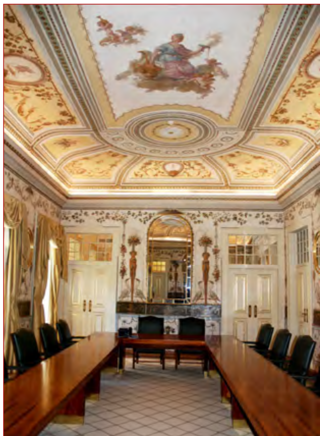
Figura 13 Visualização geral da Sala de Jantar do Palácio Porto Covo [Em linha]. [Consultado 20.10.2016]. Disponível na internet: http://www.casaruibarbosa.gov.br/acasasenhorial/ .