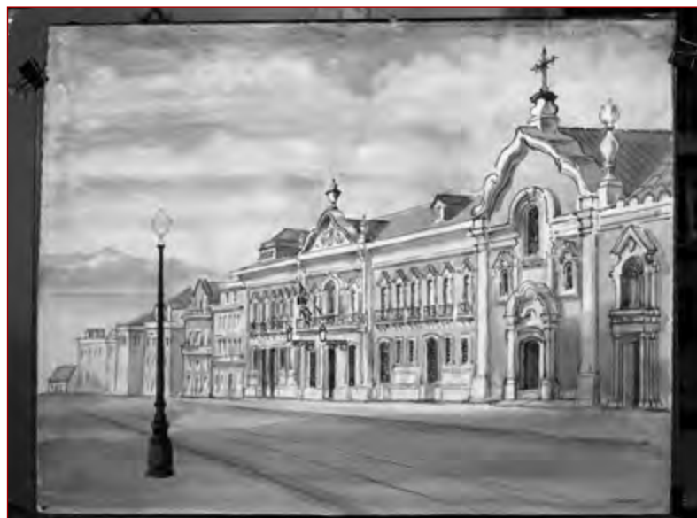
Figura 1 Palácio dos Viscondes de Porto Covo da Bandeira [Em linha]. Fotografia do estúdio de Mário Novais da aguarela do pintor inglês David Ponsonby, datada de 1968. Lisboa: Arquivo Municipal de Lisboa (AML), PT/AMLSB/CMLSAH/PCSP/004/MNV/001334.

Não existe qualquer tipo de documentação que comprove o nome do arquiteto envolvido, mas, e segundo José Romão, este atribui o risco do palácio a “Joaquim de Oliveira e não Manuel Caetano de Sousa como durante muito tempo se admitiu” 18 . Baseia esta sua pesquisa na verosimilhança arquitetónica entre o frontão da capela do palácio Porto Covo e a igreja Nossa Senhora Jesus (igreja paroquial das Mercês). De fato, numa nota manuscrita de Honorato José Correia de Macedo e Sá, e na entrada referente a Joaquim de Oliveira diz-se assim: “he seo o desenho do frontispício da igreja de Jesus, e todo o convento por ele reformado” 19 . Apesar das notórias semelhanças entre a capela do palácio Porto Covo e a igreja de Nossa Senhora de Jesus, importa salientar que, a título de exemplo, a igreja de Corpus Christi , na rua dos Fanqueiros, apresenta igualmente um frontão contracurvado encimado por fogaréus, decorrente das obras de reconstrução empreendidas pelo arquiteto do Senado, Remígio Francisco de Abreu, após o terramoto de 1755. É por isso difícil definir o arquiteto do palácio Porto Covo sem base documental. Uma coisa é certa: é um palácio com reminiscências fortemente vinculadas a um formulário de cariz barroquizante, muito na senda de Manuel Mateus Vicente, “traindo uma tradição que ainda não tinha morrido completamente” 20 .