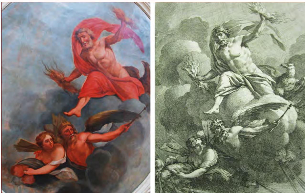
Figuras 4 e 5 Pintura de teto da escadaria do palácio Porto Covo (Fotografia: autora, 2013), realizada a partir de gravura de Michel Dorigny de uma pintura de Simon Vouet. In VOUET, Simon; DORIGNY, Michel – Porticus bibliothecae illustrissimi. Seguerii Galliae Cancellarii a Simone Voüet pictore regio depicta , Paris: [s.n.], 1640.

(fundada em 1648) 42 , como Pierre Charles Tremolières. Na generalidade, este método era seguido pelos pintores de História (veja-se o caso de Nicolas Poussin) e pressupunha o conhecimento de inúmeras fontes gravadas, pois era o meio por excelência do método de criação artística em Portugal. O país confrontava-se com a inexistência de um ensino académico estruturante, bem como das obras de pintores consideradas casos de estudo nas melhores academias europeias, pois promoviam a “fecunda imaginação” 43 .