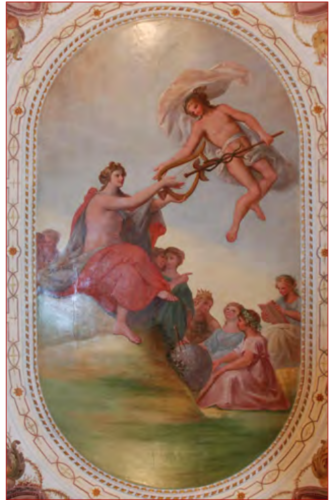
Figura 12 Pormenor dos deuses Apolo, Mercúrio e as musas de Cyrillo Volkmar Machado. Fotografia da autora, 2013.

e pequenos; porém todos de auctor conhecido, e celebre; colocados em simetria, e capazes de divertir muito tempo a qualquer entendimento hábil” 66 . Além das pinturas, a sala era composta de “excelentes cadeiras de pau magno com almofadas de damasco verde; e duas bancas, uma defronte da outra com um relógio, e em ambas várias peças preciosas de loiça da India” 67 . No Catálogo dos Objectos de Arte... , citado anteriormente, existem descrições de inúmeras peças que podem corresponder às descrições de Ignácio Menezes – seria uma tarefa