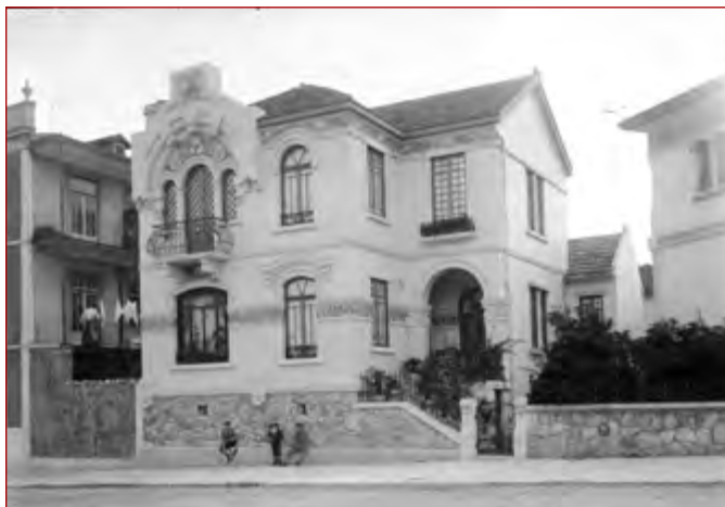
Figura 11 Casa António Pinto da Fonseca Mota, rua Pinheiro Chagas, negativo de gelatina e prata em vidro, 13x18 cm, Paulo Guedes, [19--].

AML, PT/AMLSB/CMLSB/PCSP/004/PAG/000664.