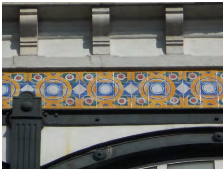
Figura 7 Frisos azulejares na fachada poente do edifício Armazéns Casa do Povo d'Alcântara. Fotografia do autor, 3 de maio de 2011.

A maestria de José António Jorge Pinto no uso de cores, dos seus tons e técnicas comprova o engenho que tinha na arte da cerâmica. A capacidade notável em reinterpretar as diversas influências estrangeiras foi expressa num variado conjunto de azulejaria, o que o torna num dos pintores mais profícuos e originais deste período. Parte do seu trabalho encontra-se em edifícios que foram contemplados pelo Prémio Valmor.