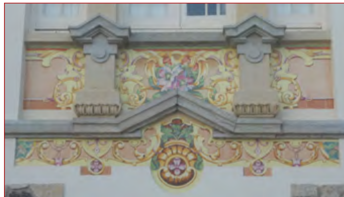
Figura 8 Painéis no grande janelão da fachada nascente do Chalet Malvina , fotografia do autor, 18 de setembro de 2011.

após o seu casamento, em 1906, na rua Tomás Ribeiro. Participou em várias exposições e parece ter enveredado, a partir de 1906, pela azulejaria. Efetivamente, na sua obra, temos vindo a constatar uma influência da Arte Nova francófona e o gosto pela época da Renascença (em voga no início do século XX), nomeadamente na azulejaria produzida pelas já referidas manufaturas Hautin-Boulenger & Co e Maison Helman . Explorou o constraste entre cores, o emprego de tons lustrosos e outras características muito peculiares. Não parece ter trabalhado diretamente com uma única manufatura mas cozido em várias oficinas, as suas obras em azulejo 64 .