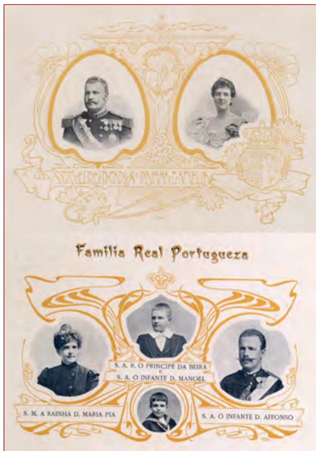
Figura 2 Montagem das fotografias emolduradas com a Família Real Portuguesa, o grafismo é da autoria de Alonso. Album Açoriano Oliveira & Baptista (1903).

especificamente colocado segundo o projeto do mesmo arquiteto 26 . Os azulejos têm sido atribuídos à já mencionada manufatura das Devesas 27 .