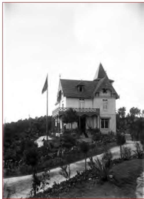
Figura 1 Chalet Montrose por ocasião da estadia da rainha Dona Maria Pia, negativo de gelatina e prata em vidro, 18x24 cm