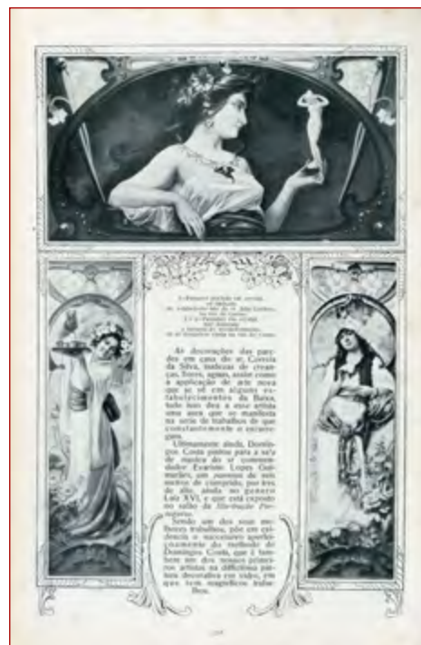
Figura 15 Paineis para a fachada do Armazém de Novidades João Cardozo, em cima. Alegoria ao Chá e ao Café, em baixo, e que figuraram as duas na Exposição Nacional no Rio de Janeiro em 1908. Ilustração Portuguesa . 2. a Série N.º 264 (13 de março de 1911), p. 352.