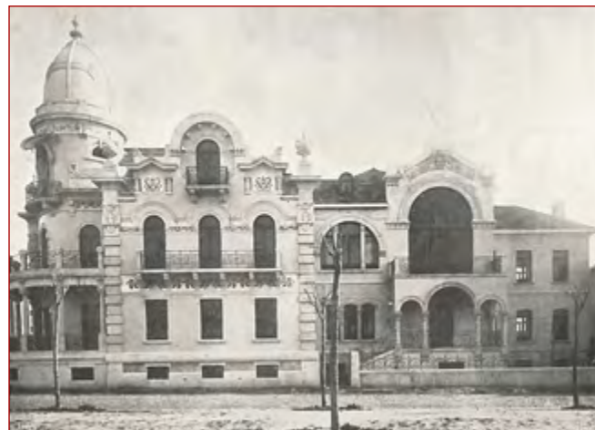
Figura 12 Edifício Amélia Augusta Pereira Leite. A Architectura Portuguesa Ano III N.º 3 (março de 1910), Intercalar VI.

AML, PT/AMLSB/CMLSB/PCSP/004/PAG/000664.