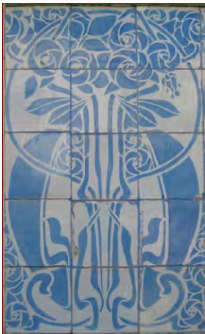
Figura 5 Motivo padronizado no vestíbulo de entrada de uma das Casas Alvaro Machado no Estoril, em azul. A originalidade na interpretação da Arte Nova, deste conjunto, foi adaptada ao gosto português pelo uso do azul sobre fundo branco no azulejo. Fotografia do autor, 8 de janeiro de 2010.

trabalho do arquiteto escocês Charles Rennie Mackintosh, ao representar as rosas. Esta representação também foi seguida pela manufatura alemã Grohner Wandplattenfabrik e pela Villeroy & Boch 54 . Em Bruxelas existe este tipo de rosas em esgrafito, nomeadamente: num edifício na rue des Eburons , datado de 1898, e na fachada principal da casa do arquiteto Paul Cauchie, construída em 1905 55 .