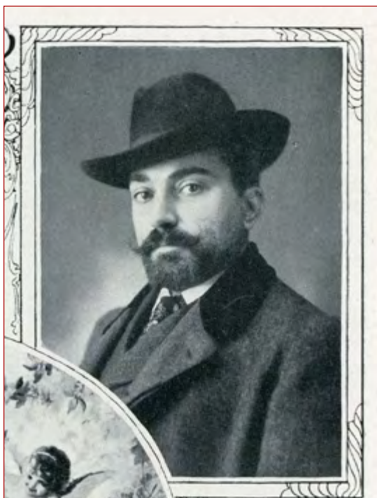
Figura 14 O pintor Domingos Maria da Costa. Ilustração Portuguesa 2. a Série N.º 264 (13 de março de 1911), p.350.