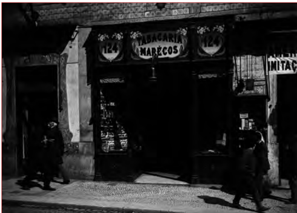
Figura 3 Café/Restaurante/Cervejaria Imperial, lado esquerdo, e ao centro a Tabacaria Marécós, remodelada em 1912, negativo de gelatina e prata em vidro, 9x12 cm, Alberto Carlos Lima, [191-]. AML, PT/AMLSB/CMLSBAH/ PCSP/004/LIM/001050.

influência francófona no seu trabalho, além do gosto pelas formas geométricas do Jugendstil . Uma percentagem razoável dos seus projetos foi decorada com azulejaria realizada pelo pintor José António Jorge Pinto, como iremos abordar.