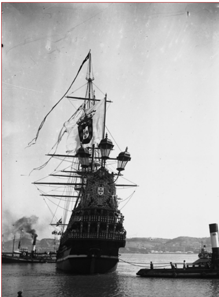
Figura 5 Comemorações do Duplo Centenário: exposição do Mundo Português. Nau Portugal vista de proa. Paulo Guedes, 1940. AML, PT/AMLSB/CMLSBAH/PCSP/004/PAG/000386.

a 2 de maio seguinte pela Direção Geral da Fazenda Pública. Nela se afirma que da construção dos interiores da referida embarcação não sobrou nenhuma talha e que, por tal, o pedido do pároco de Borba não poderia ser satisfeito 38 .