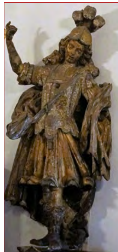
Figura 13 Escultura de vulto com atributos de Santiago. Palácio dos marqueses da Fronteira. Lisboa.