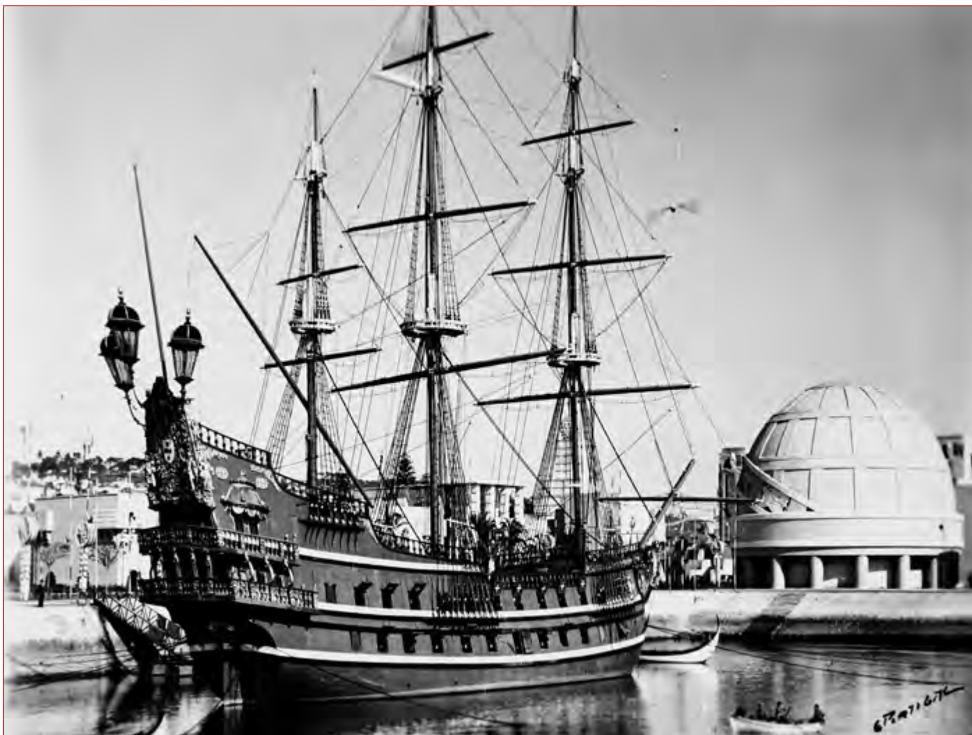
Figura 4 Comemorações do Duplo Centenário: exposição do Mundo Português. Vista da Nau Portugal . Eduardo Macedo Portugal, 1940. AML, PT/AMLSB/CMLSBAH/PCSP/004/EDP/001550.

os trâmites pelos quais se regeram, quer esses mesmos empréstimos, quer posteriormente as ações e condições de devolução das peças cedidas.