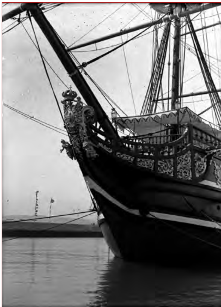
Figura 7 Comemorações do Duplo Centenário: exposição do Mundo Português. Vista da popa da Nau Portugal . Álvaro Ferreira da Cunha, 1940. AML, PT/AMLSB/CMLSB/PCSP/004/FEC/000247.

Encerrada a Exposição do Mundo Português , a 2 de dezembro de 1940, a Nau Portugal continuou atracada em Belém, esperando um destino condigno. No entanto, a 15 de fevereiro do ano seguinte, Portugal é assolado por um violento ciclone que devastou várias cidades do país. Lisboa não foi exceção e a Nau Portugal , ancorada em Belém, não escapou à violenta ação do fenómeno atmosférico. O Jornal O Século destacou na sua primeira página de 16 de fevereiro de 1941, o terrível ciclone que afetou Portugal, causando vítimas e avultados prejuízos materiais, salientando precisamente os efeitos devastadores que teve na Nau .