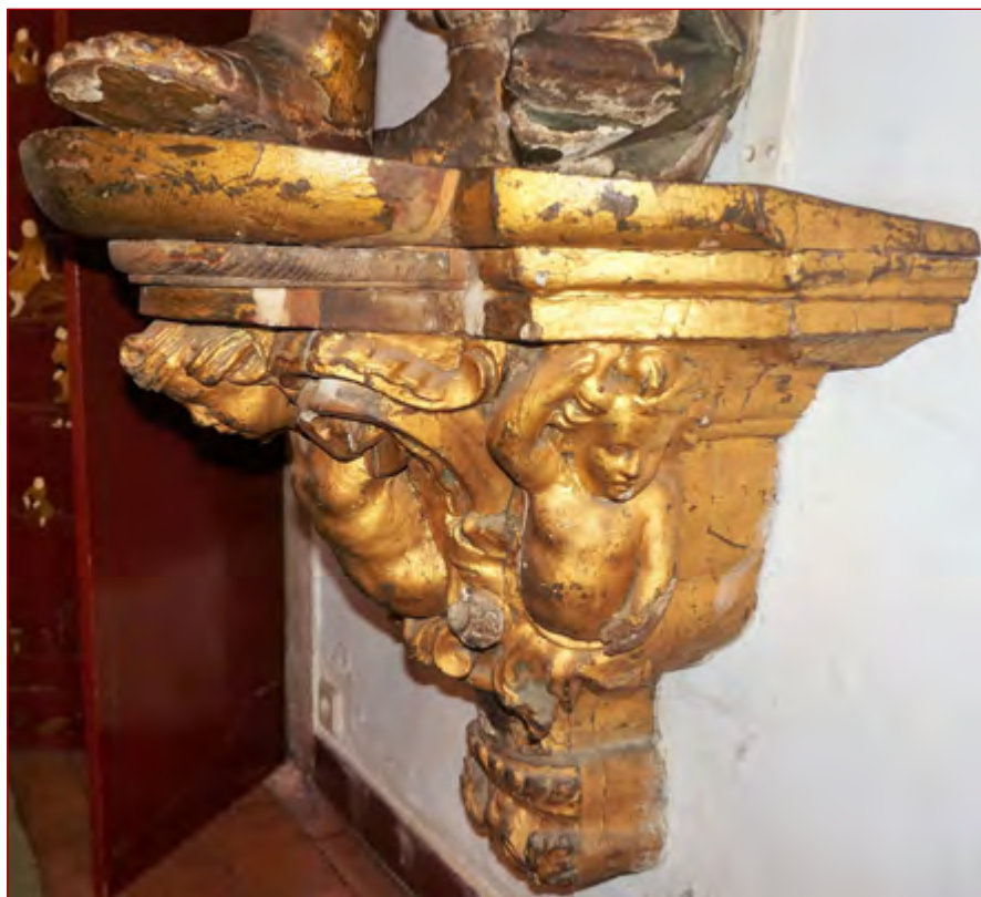
Figura 15 Peanha de escultura de vulto com atributos de Santiago. Palácio dos marqueses da Fronteira. Lisboa.