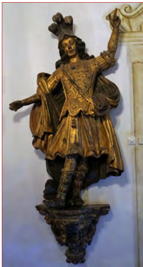
Figura 14 Escultura de vulto com atributos de Santiago. Palácio dos marqueses da Fronteira. Lisboa.

A Nau , mais do que um objeto concreto, foi uma ideia que transbordou as fixas categorias da realidade. Momento cénico por excelência, a vivência do espírito pleno da Nau pretendia projetar o visitante para um tempo glorioso,