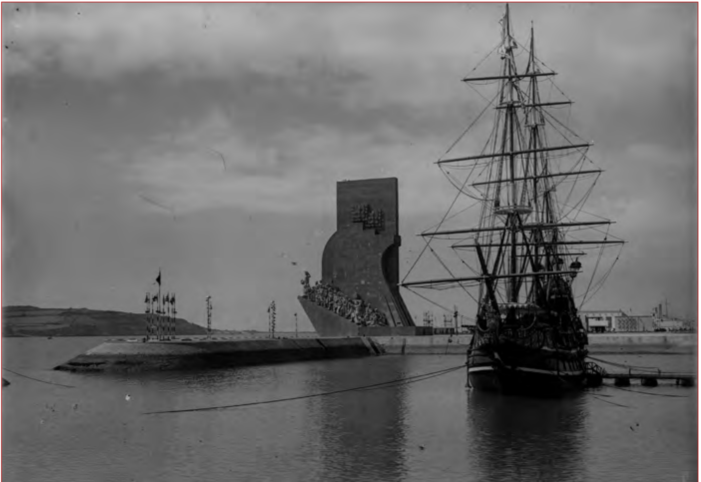
Figura 3 Comemorações do Duplo Centenário: exposição do Mundo Português. Nau Portugal tendo como fundo o monumento efêmero Padrão dos Descobrimentos. Paulo Guedes, 1940. AML, PT/AML SB/CMLSBAH/PCSP/004/PAG/000385.

Sobre essa cedência, João Couto tece várias considerações, que expõe sucintamente em cinco pontos: