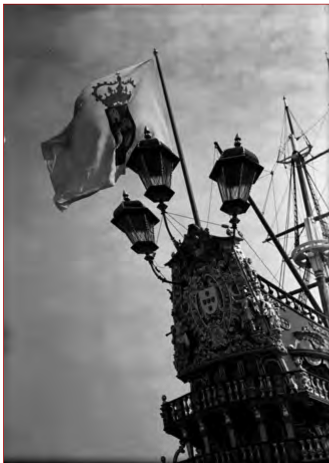
Figura 8 CUNHA, Comemorações do Duplo Centenário: exposição do Mundo Português. Nau Portugal . Pormenor da proa. Álvaro Ferreira da Cunha, 1940. AML, PT/AMLSB/CMLSBAH/PCSP/004/FEC/000244.