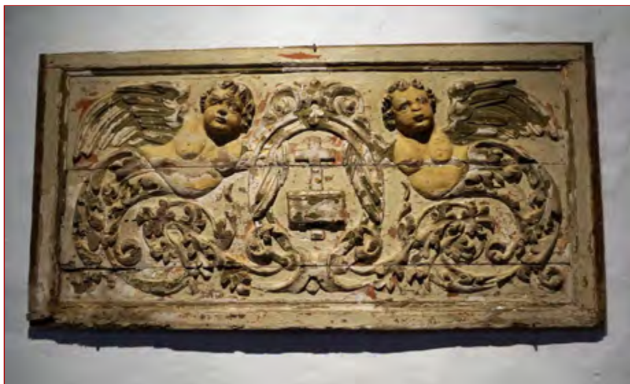
Figura 11 Painel de talha com duas figuras híbridas. Sala Casa Monsaraz.

Uma das casas que pertenceu a António Júdice Bustorff Silva, e que visitámos, situa-se na vila de Monsaraz no Alentejo. O atual proprietário gentilmente aceitou mostrar-nos o espólio da casa e verificou-se a existência de várias peças de talha, nomeadamente um par de colunas torsas, que poderão ser oriundas do espólio da Nau 47 .