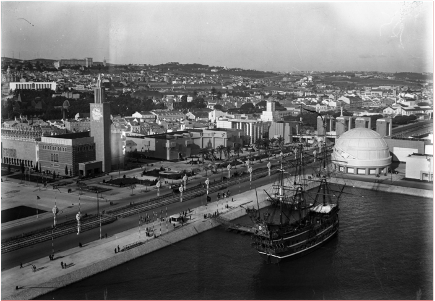
Figura 1 Comemorações do Duplo Centenário – Exposição do Mundo Português. Vista panorâmica da Exposição do Mundo Português com a Nau Portugal ancorada no Tejo. Paulo Guedes, 1940. Arquivo Municipal de Lisboa (AML), PT/AMLSB/CMLSB/PCSP/004/PAG/000356.

Um dos relatos mais contristados sobre o desastre teve por autor, o então arcebispo de Aveiro, D. João Evangelista Vidal que, no dia seguinte ao incidente, escreve: