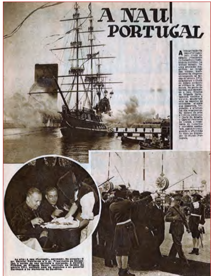
Figura 2 Página da revista O Século Ilustrado figurando a inauguração da Nau Portugal . Salazar e o cardeal Cerejeira são servidos a bordo da Nau . O Século Ilustrado . Nº 141 (14 setembro 1940), p. 9.

Numa primeira e única referência à talha, que adornava exteriormente a nau, refere que a mesma foi esculpida por mestre Abraão de Carvalho, natural do Porto.