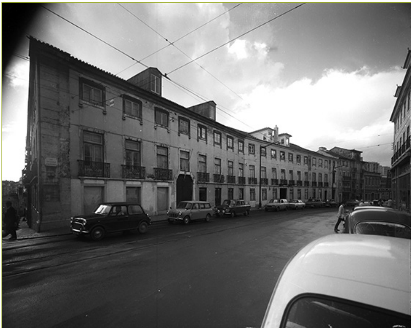
Figura 1 Casas nobres, ditas palácio Cruz Alagoa, atual rua da Escola Politécnica. AML, PT/AMLSB/SER/S05015.