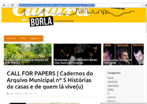
Call for papers

http://culturadeborla.blogs.sapo.pt/call-for-papers-cadernos-do-arquivo-2965039